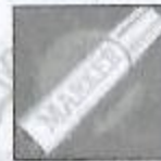
Missile niveau 3